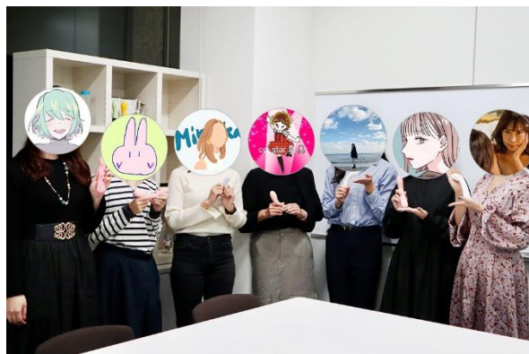
TENGA本社で開催された新商品の先行モニター座談会